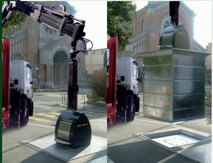
Detalle de la recogida de residuos.