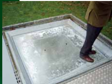
Detalle de la plataforma de seguridad.