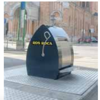
Palanca para minusválidos.